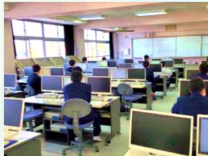
高校での講座風景